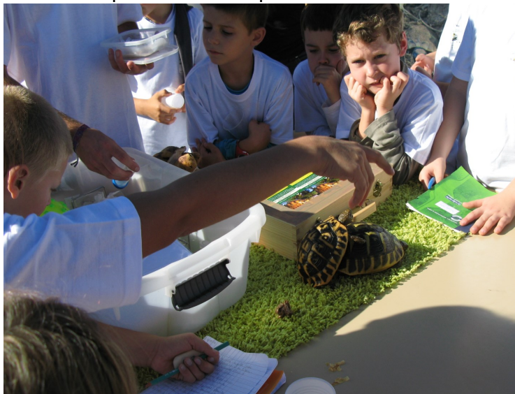
Deux étudiants nous ont présenté la vie de la tortue d'Hermann.

* Un animal, une plante hybrides proviennent d'un croisement de 2 espèces différentes.