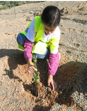
Voici comment nous avons planté les arbres.

Les arbres sont plantés pour refaire la forêt lorsque la carrière n'est plus. On a planté des arbres, des arbustes puis on a posé des groasis* autour de chaque arbuste.