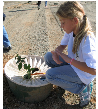
Le groasis est placé autour de l'arbuste.

*groasis : système qui permet de retenir l'eau de pluie pour arroser les arbres.